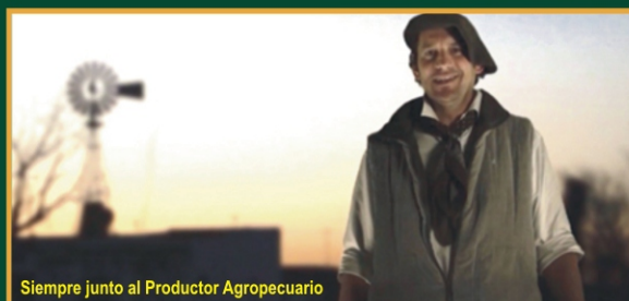
Siempre junto al Productor Agropecuario

COOPERATIVA DE PRESTACIÓN DE SERVICIOS MÉDICO ASISTENCIALES LIMITADA